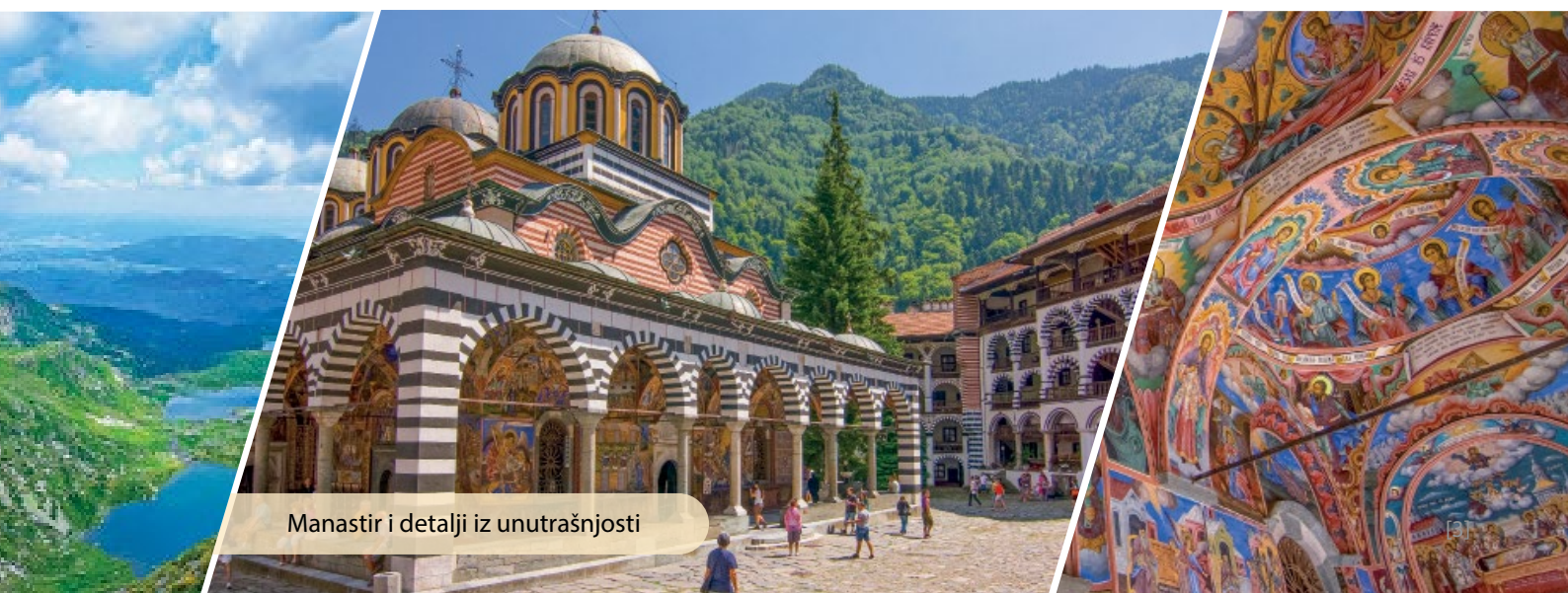
Manastir i detalji iz unutrašnjosti

Više o destinaciji: https://youtu.be/UCeM5bfdYw