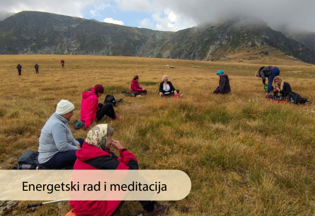
Energetski rad i meditacija