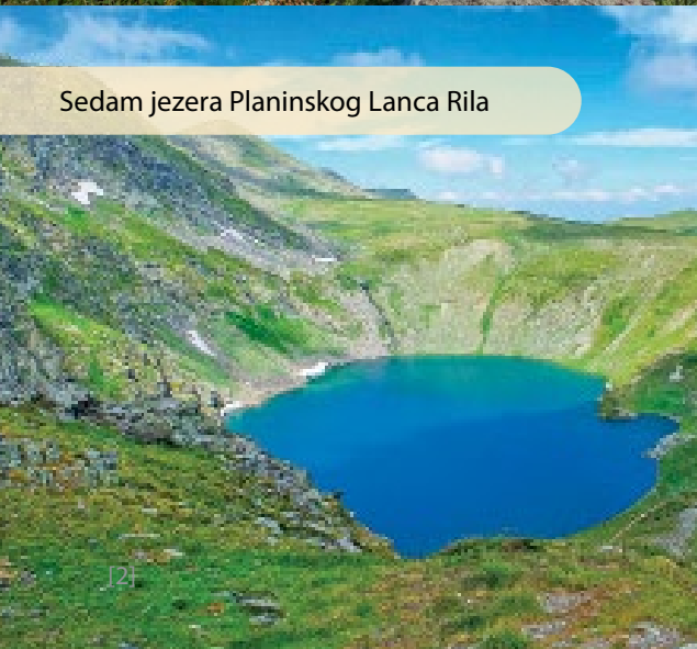
Sedam jezera Planinskog Lanca Rila

Jezera Rila su od davnina privlačila štovatelje prirode, ali i duhovnosti. Pridružite se ovom iskustvenom putovanju i osnažite svoju nutrinu prekrasnim krajolikom, meditacijama, svjesnim disanjem i ceremonijama povezivanja s elementima. Obnovite se, povežite i iscijelite kroz 5 dana svjesnog boravka na mjestu koje se ističe posebnom ljepotom, ali i energetska, duhovnom snagom. Dozvolite svom umu i tijelu da dožive opuštanje, a duhu da se poveže sa mudrošću i snagom prirode i divljine.