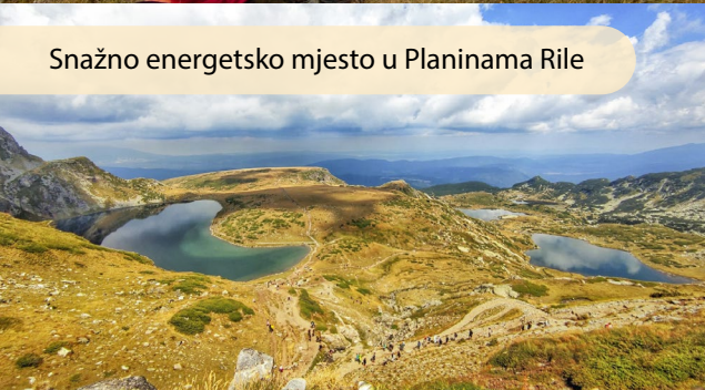
Snažno energetska mjesto u Planinama Rile